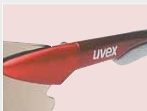
El llamativo diseño de las patillas agrega estilo.