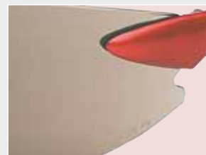
El estilo envolvente de base nueva proporciona una cobertura superior y protección cercana al rostro.